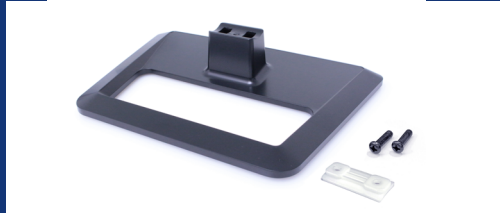
Standfuß, Schrauben, Kunststoffgegenplatte SLA-Linie+