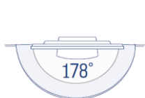
Weitwinkeldisplays von höchster Qualität